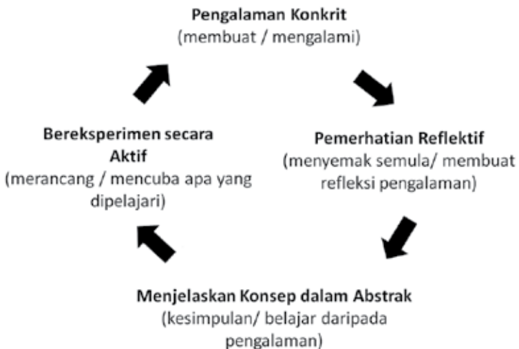
Rajah 1: Kolb' Experiential Learning Cycle .

Teori Pembelajaran berasaskan Pengalaman (Experiential Learning Theory/ ELT) yang diasaskan oleh Kolb (1984) menjelaskan bahawa pengalaman menjadi satu bentuk pembelajaran melalui satu kitaran yang melibatkan proses mengalami, merenung, berfikir dan bertindak. Kolb mentakrifkan pembelajaran sebagai satu proses penciptaan pengetahuan melalui transformasi pengalaman. Ilmu pengetahuan terhasil daripada gabungan pemahaman dan transformasi sesuatu pengalaman. Berpandukan ELT, Kolb membentuk Kitaran Pembelajaran berasaskan Pengalaman ( Experiential Learning Cycle/ ELC ) yang melibatkan 4 elemen atau tahap iaitu pengalaman konkrit ( Concrete Experience - CE ), pemerhatian dan renungan ( Reflective Observation – RO ), pembentukan konsep abstrak ( Abstract Conceptualization – AC ), dan pengujikajian aktif ( Active Experimentation – AE ).