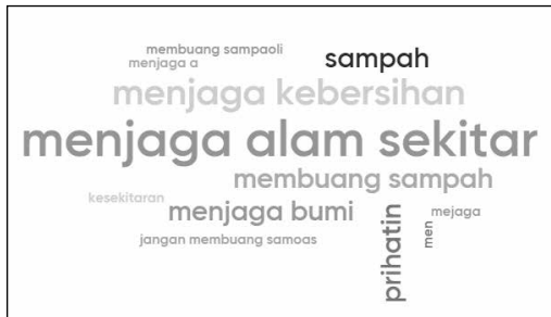
Rajah 1: Respons Word Cloud Murid Selepas Menonton Video

Bagi bahagian “Lihat” dalam rutin berfikir, secara berpasangan, murid menyumbang saran mengenai tema video. Kemudian, mereka memberikan tiga tema yang sesuai berdasarkan video yang mereka tonton dengan menggunakan Word Cloud Mentimeter . Rata-rata murid menyerlahkan kosa kata “menjaga alam sekitar”, “menjaga kebersihan” dan “membuang sampah” dan “menjaga bumi”. Ini jelas memberikan gambaran tentang apa yang telah murid lihat berdasarkan video yang ditonton. Ini jelas memberikankan petanda, murid terlibat dalam pembelajaran.