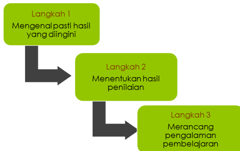
Rajah 2 : Langkah dalam kerangka Pemahaman Melalui Perancangan