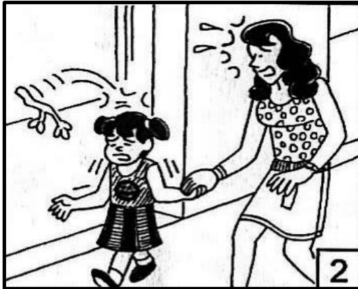
Jadual 2: Respons Murid Berdasarkan Gambar 2