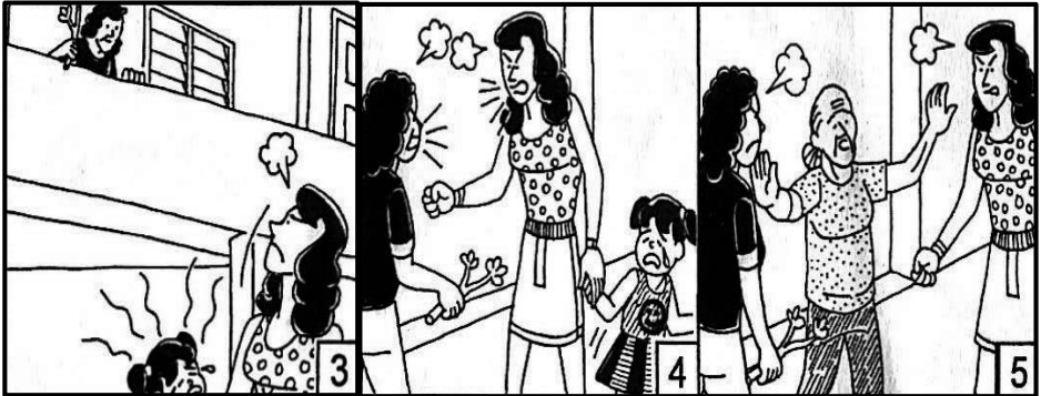
Rajah 2: Gambar bersiri Nombor 3-5

Langkah selanjutnya, murid menjalankan aktiviti melengkapkan templat perancangan 5W1H secara individu ( You do ). Murid memberikan kosa kata dan melengkapkan bahagian Tanya dan Respons templat tersebut berdasarkan gambar 3, 4 dan 5 pula. Seterusnya, murid menulis beberapa potong ayat dalam satu perenggan menggunakan idea yang dicatatkan dalam templat tersebut. Lihat respons murid berdasarkan Rajah 2 dalam Jadual 3 di bawah ini.