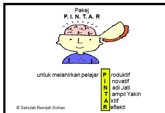
Rajah 1: PINTAR

P.I.N.T.A.R bertujuan untuk menanam minat membaca sekaligus mengukuhkan penguasaan bahasa Melayu murid. Akronim P.I.N.T.A.R bermaksud P – Produktif, I – Inovatif, N – Nadi Jati, T – Tampil Yakin, A – Aktif dan R – Reflektif. Elemen-elemen P.I.N.T.A.R ini saling melengkapi dalam membina sikap positif untuk menjadi seorang pelajar yang pintar iaitu serba boleh dalam segala hal. Lihat Rajah 1.