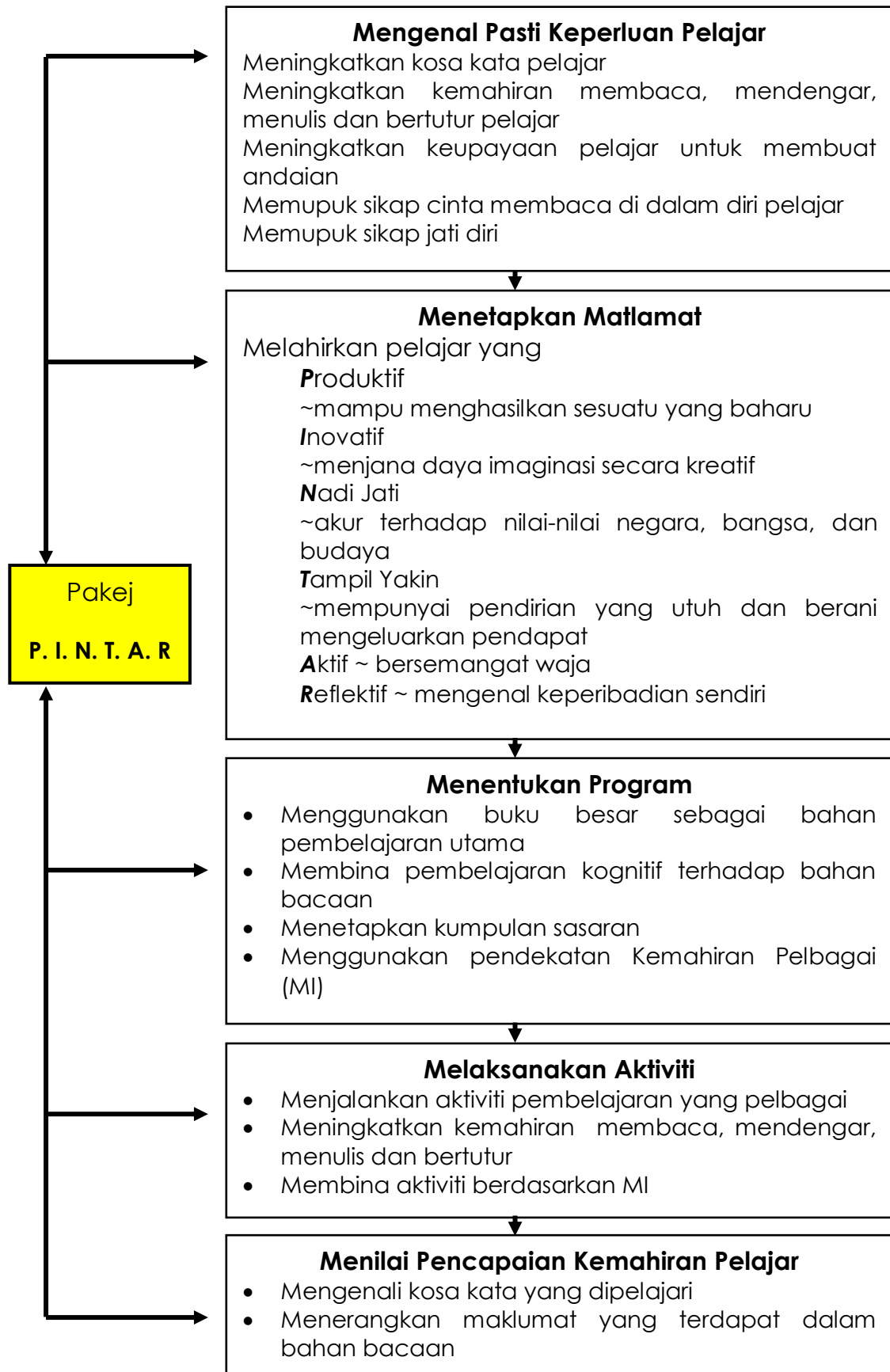
Jadual 2: Metodologi Penyelidikan